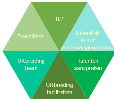
Mogelijkheden die groei biedt